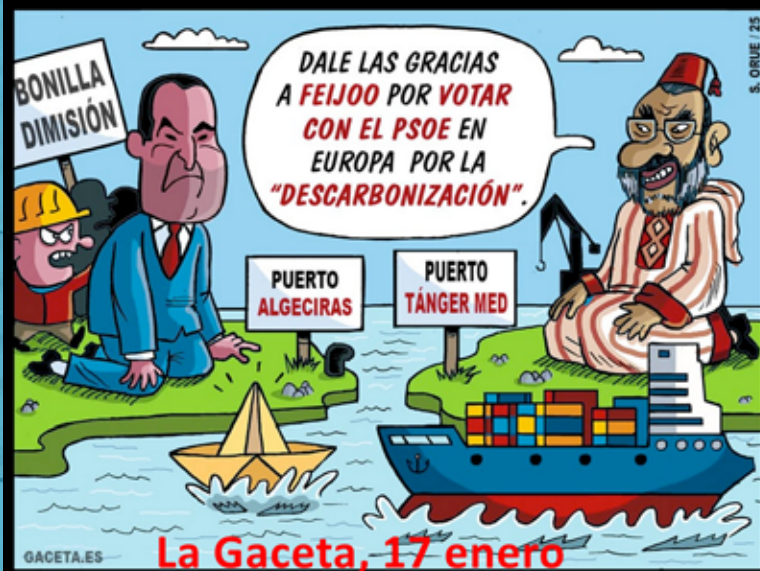
La Gaceta, 17 enero